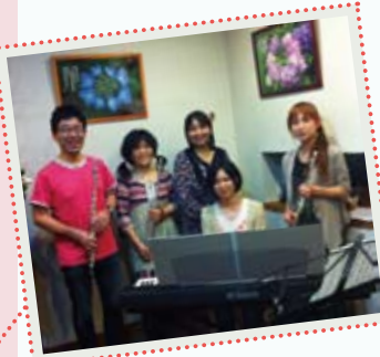
【練習風景】見た目と音のギャップから、「ちーむぎゃっばーず」と命名しました!