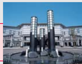
仙台国際センター